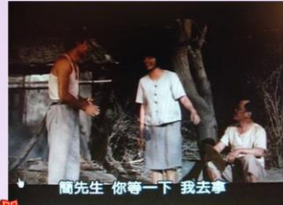
本作品來自《綠歌一半軍》電影截圖。 本資料庫根據中華民國著作權法第52及65條合理使用。

小說全篇為第三人稱的描述，以阿發為觀點人物。電影的觀點人物時而為阿發，時而為阿狗。以阿發為觀點人物時，常以畫面與聲音不協調，甚是無聲的畫面突顯出阿發的耳聾。