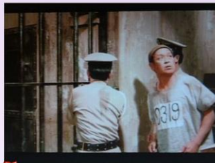
本作品來自《綠放一半》電影截圖， 本資料庫根據中華民國著作權法第52及65條合理使用。

在電影裡阿發一家總共有四個小孩，三女一男，剩下的小男孩，叫阿狗，電影中強化了阿狗(小說中的阿五)，有時以其為觀點人物敘事。