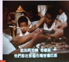
本作品來自《嫁妝—牛車》電影截圖， 本資料庫根據中華民國著作權法第52及65條合理使用。