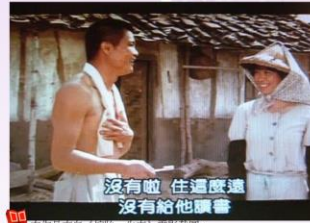
本作品來自《綠歌一半軍》電影截圖。 本資料庫根據中華民國著作權法第52及65條合理使用。