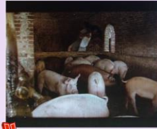
本作品來自《嫁妝—牛車》電影截圖， 本資料庫根據中華民國著作權法第52及65條合理使用。