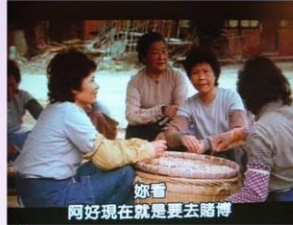
本作品來自《癡歌—牛車》電影截圖。 本資料庫根據中華民國著作權法第52及65條合理使用。